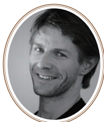
カール・パケット (国立パリ・オペラ座エトワール)